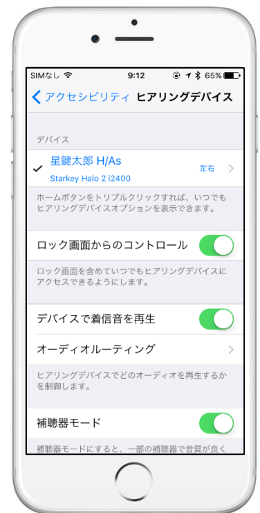
iOS デバイスとのペアリング状態

注意: Halo2、Halo は最大 5 つの iOS デバイスに認識されますが、1 度にペアリング可能な iOS デバイスは 1 台のみになります。そのため、必ずペアリングしない iOS デバイスの Bluetooth 機能をオフにした状態でペアリングを開始して下さい。