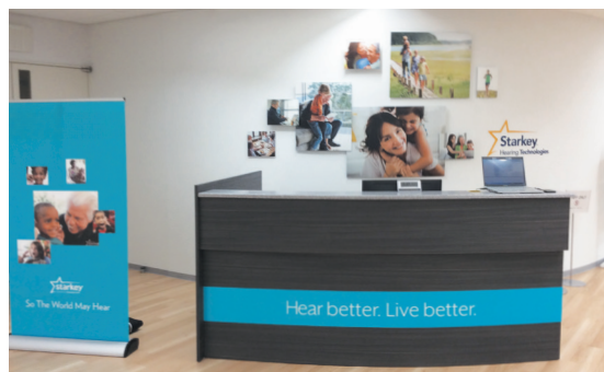
カンファレンスルーム

スターキージャパンは2017年、新たにMDC (Market Development Center) を開設しました。このMDCは、スターキー製品の販売及び、サービス・トレーニング・オーダー・修理に関して専門の部隊を持ち、教育の機会を提供する、お客様との共同スペースをコンセプトにしています。