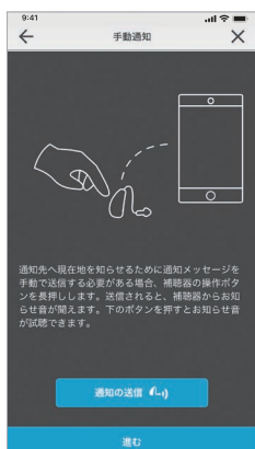
手動通知が 送信された時