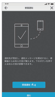
通知が 受信された時