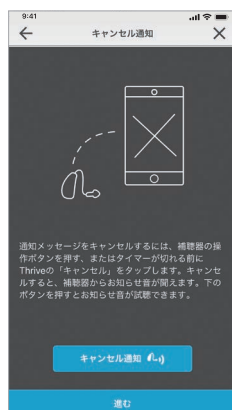
通知を キャンセルした時