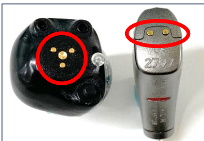
補聴器側↑と、充電器側↓の接点部