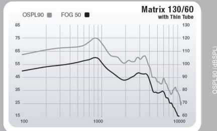
Muse IQ mini BTE 312 (スマートイヤフック)

■医療機器承認番号 スターキー耳かけ型 1 : 228ADBZX00025000 SPEC0097-02-JJ-JP/JPSYSP-097 BTE312